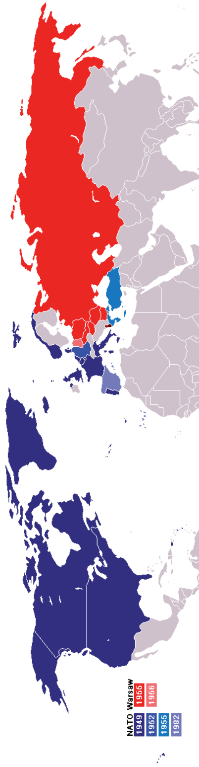
Zdjęcie 1. Państwa wchodzące w skład NATO i Układu Warszawskiego w 1989 r.